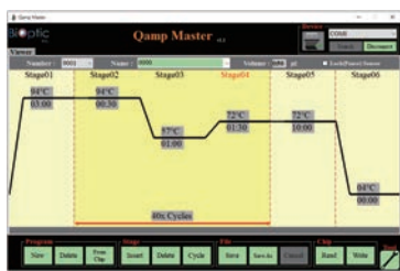
ソフトウェア操作画面