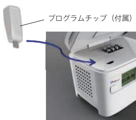
プログラムチップ (付属)