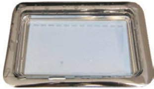
輸送や保存においてゲルが破損しない専用容器を採用しています