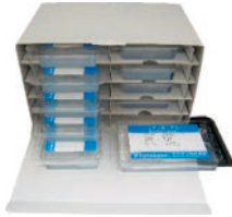
ゲルの出し入れがしやすい専用箱に入れてお届けします