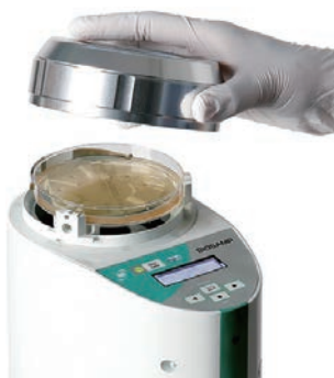
11.0 W ×18.0 D ×23.4 H cm, 1.5 kg