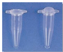
フラット型 ドーム型 0.2 ml