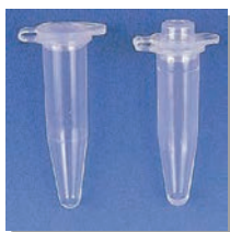
フラット型 ドーム型 0.5 ml