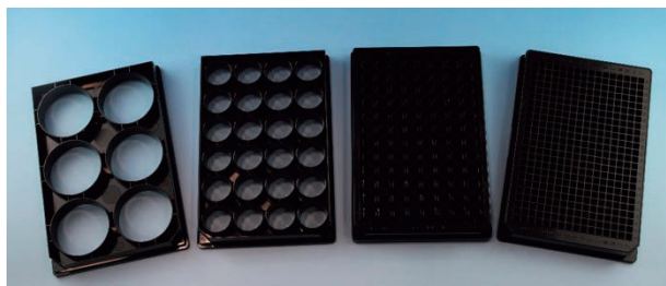
底なしマイクロプレート