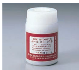
粒子の大きさ: 2~4 mm ポアサイズ: 20~50 μm

カルシウムやマグネシウム、重金属などを含まない、焼結ガラスで作られた人工沸騰石です。