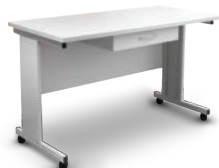
T-4L Table (UVT-S-AR 用)