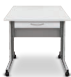
T-4 Table (UVC/T-AR と UVC/T-M-AR 用)