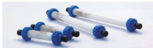
カラムプレバック製品

天然の Protein A などを改変し、抗体への親和性を高めたセルロース基材のアフィニティ精製用レジン (担体) です。