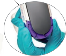
分注量設定ダイヤル