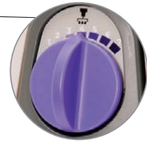
分注スピード設定ダイヤル (ali-Q 2 VS のみ)