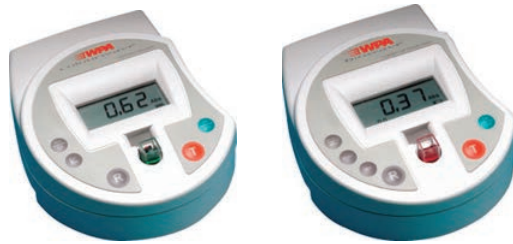
15 W ×18 D ×6 H cm (共通)