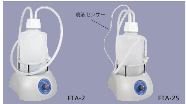
18.5 W ×29.0 D ×39.0 H cm (廃液ボトル含む)