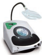
25 W ×33 D ×17.5 H cm