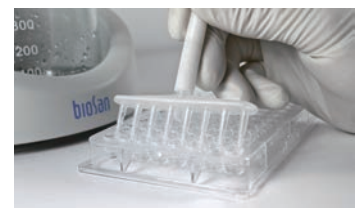
8 チャンネルマニホールドアダプター (別売品)