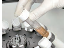
ローター R-12/15 使用時