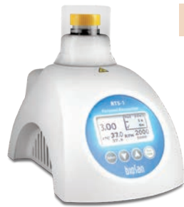
13.0 W ×21.2 D ×20.0 H cm

※別途 PC (OS : Windows XP/Vista/7/8/8.1/10) が必要です。