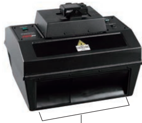
50.2 W ×41.9 D ×39.1 H cm

クロマトビューキャビネットとデジタルカメラが一体となった、薄層クロマトグラフィー(TLC)のイメージングに最適なシステムです。