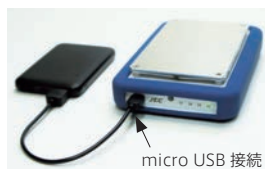
micro USB 接続