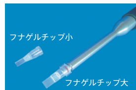
フナゲルチップ小

電気泳動後の目的バンド部分を簡単に回収できるチップです。1度だけオートクレーブ可能です。Gel Pipette (#C1000-1CF) または 1,000 \mu l ピペットに装着して使用します。