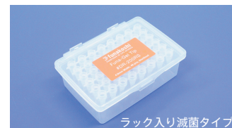
ラック入り滅菌タイプ