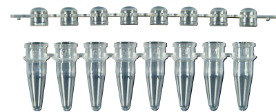
#PCR-0208-CP-C (8 連 PCR チューブと 8 連ドームキャップのセット)