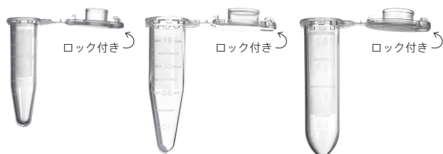
0.65 ml (#MT-0065-BC) 1.5 ml (#MT-0150-BC) 2 ml (#MT-0200-BC)