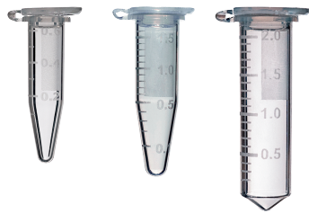
0.5 ml (#1110-10) 1.5 ml (#1210-10) 2 ml (#1310-10)