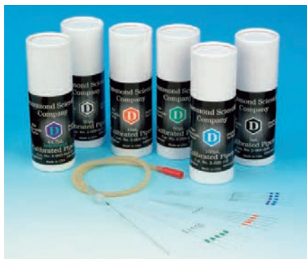
吸引チューブ、シリコンキャップ各1個付き

ラジオアイソトープ・病原体試料採取用のディスポーザブル目盛り付きガラス毛细管マイクロピペットです。