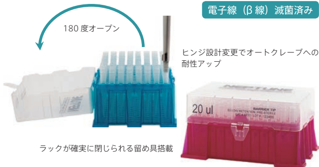
ラックが確実に閉じられる留め具搭載