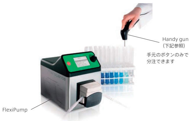
Handy gun (下記参照)