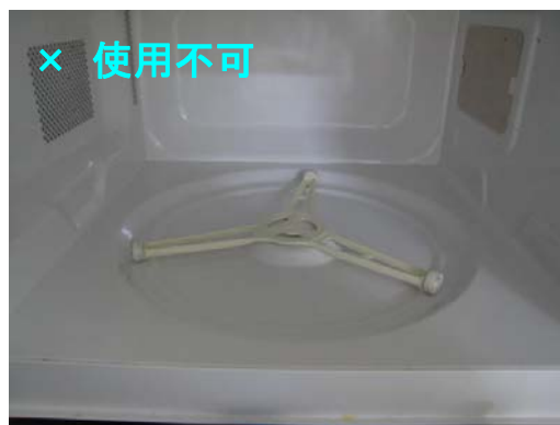
残念ながらご使用いただけません。