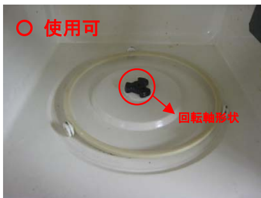
外周のローラーリングを取り外してご使用ください。 回転軸の形状にもご注意ください(4を参照)