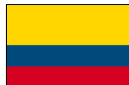
コロンビア産 FBS (#S1530)