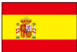
スペイン産 FBS (#S1760)