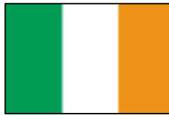
アイルランド産 FBS (#S1780)