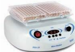
プラットホーム IPP-2 (付属品の装着例)