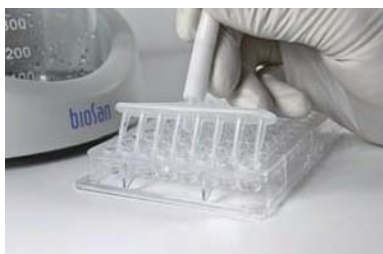
8 チャンネルマニホールアダプター(別売品)