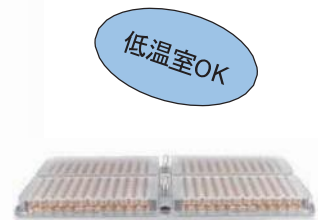
プラットホーム IPP-4 (別売品)