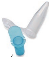
ミニストレーナーII